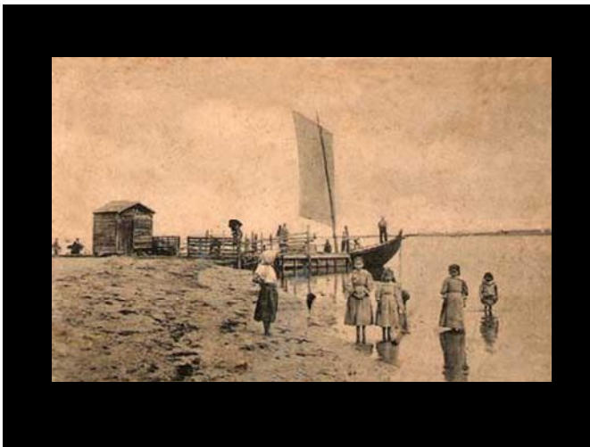
A Barca da Passagem 1900