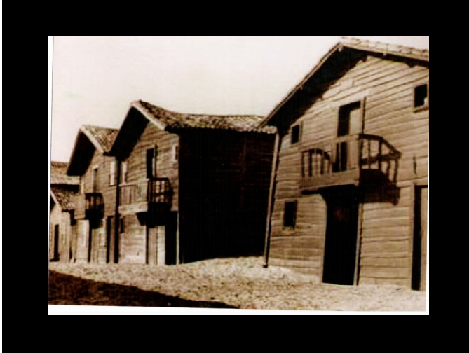
Os Palheiros ao sul