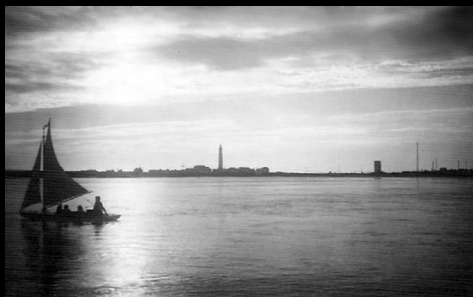
Passeando na ria