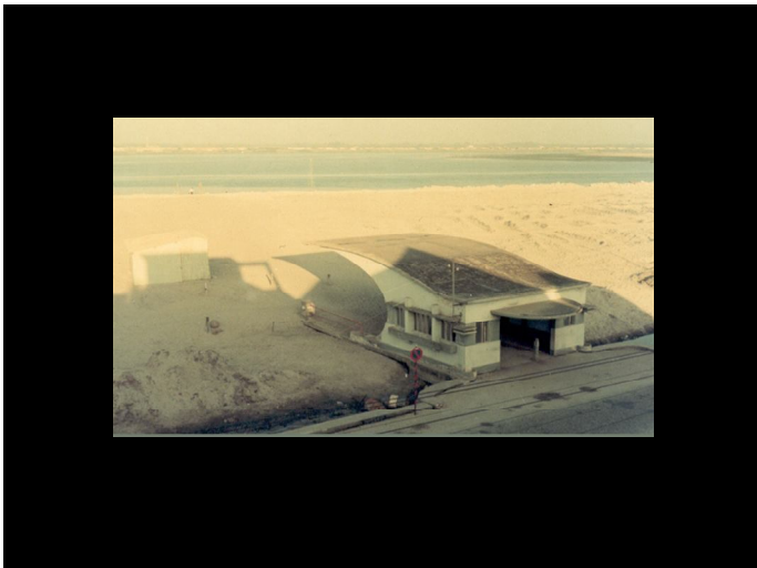
A «mota» no área