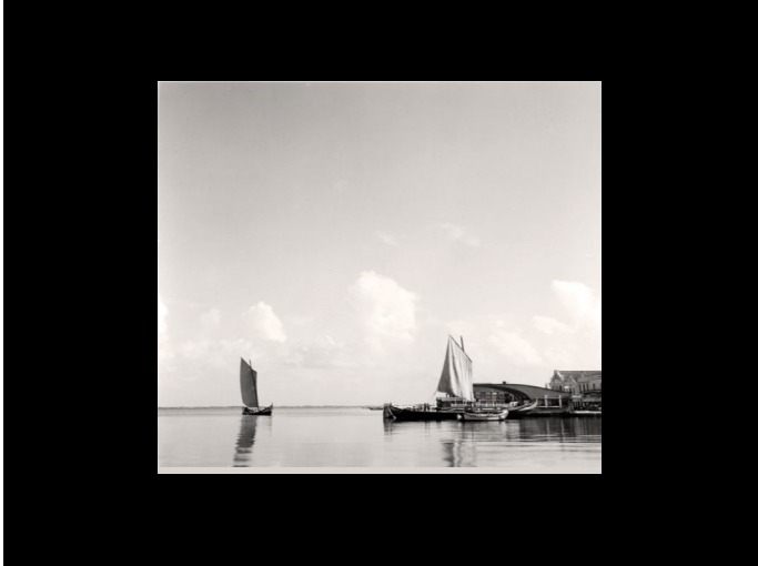
Ultimas imagens das barcas na mota