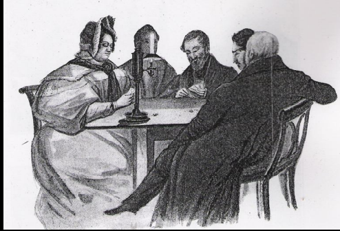
Os serões naquele tempo