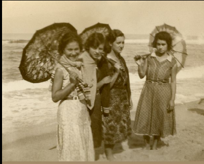
As Beldades anos 20