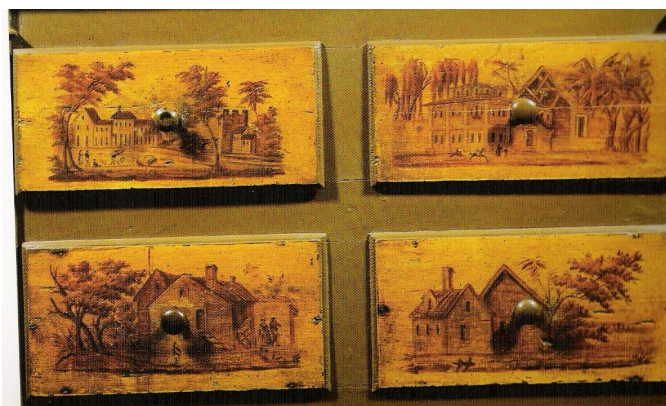
GAVETAS DA FARMÁCIA CUNHA (HOJE FARMÁCIA SENOS )

A Farmácia Cunha tem, pois, a data de fundação de 1836 , sendo praticamente contemporânea da fundação da Fábrica da Vista Alegre. Por isso, na parte inferior do escaparate dos medicamentos, atrás referido, inseriam-se ( e estão preservadas ) vinte e quatro gavetas a que minha Mãe só muito tarde, soube, terem sido pintadas pelo francês Rosseau , o primeiro mestre pintor da V.A.