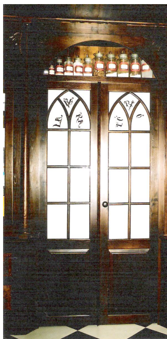
Porta do «Laboratório Chimico»

A sua traça inicial – que foi o mais possível respeitada no conceito, aquando da sua modernização – mostrava um esplendoroso móvel expositor com alçado em arco, ladeado por colunas maciças de madeira, apoiadas em parapeito a toda a roda. Na base deste distribuíam-se gavetas de notável expressão artística, que adiante referiremos. No topo posterior, que fechava em semicírculo, de frente para o cliente, podia admirar-se uma lindíssima porta envidraçada, que tinha inscrito a palavra, «Laboratório», encimada por nicho em arco, debruado com um rodapé de trança de madeira, engoivada à mão. No laboratório existia um célebre almofariz para manipulação de químicos e uma lindíssima balança de precisão. Todo o tecto côncavo, era entabuado a capa e camisa, e rematado por lindíssimos frisos