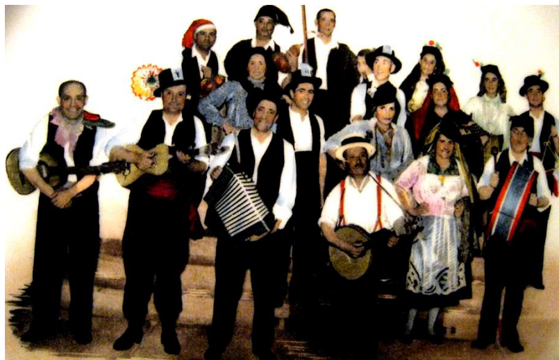
OS ROMEIROS D'ÍLHAVO