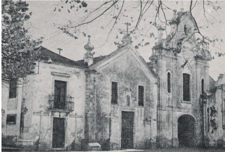
CONVENTO DE Stº ANTÓNIO

Na sessão Parlamentar de 16 de Julho de 1853 , José Estevão requereu que “ o Governo mandasse fazer planta “ para o Liceu e lhe incorporasse Biblioteca anexa, tendo sugerido que “se inquirisse da adaptação das instalações da antiga Albergaria de S. Braz ,pois ,pensava, ser esse o lugar mais próprio para a sua instalação”.