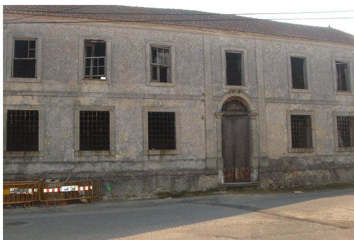
Palacete que foi de Joaquim José de Queirós 1

A primeira visita do escritor a Aveiro ,ter-se-ia dado em 1880 ,acompanhado pelo poeta Coelho de Carvalho ,e com ele visitado as propriedades da família Queirós, em Verdemilho.