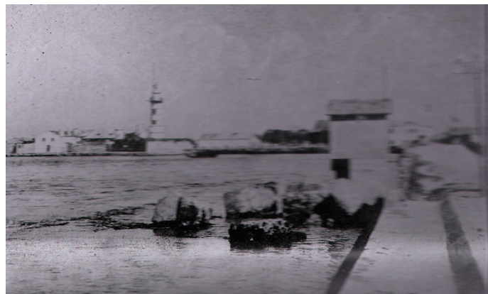
Fig. 3- O Forte visto da passagem Gafanha -Barra

Quando entregue à Junta da Barra, em 1844 , foi construída uma torre – que hoje ainda se mantém – cuja finalidade era a de servir de torre de sinais para as embarcações que demandavam o Porto de Aveiro.