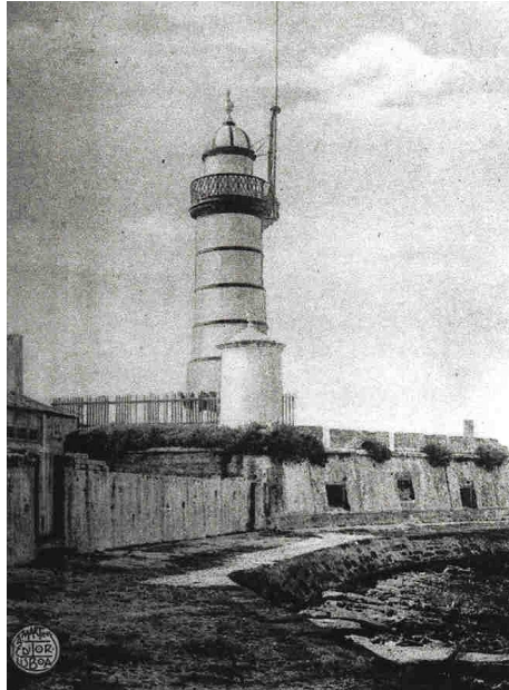
Fig 4 - Forte da Barra

Este Forte também ficou conhecido por « Castelo da Gafanha », tendo sido adquirido ao Ministério da Guerra, pela Junta Autónoma da Barra de Aveiro.