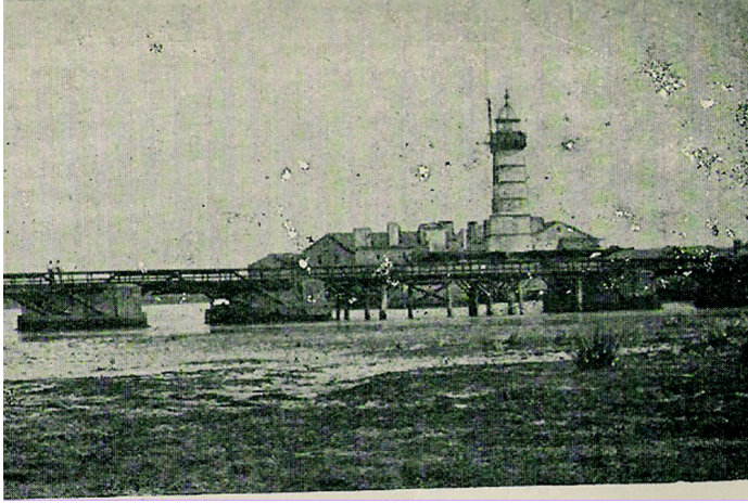
Fig. 2-O Forte no início séc. XIX /XX