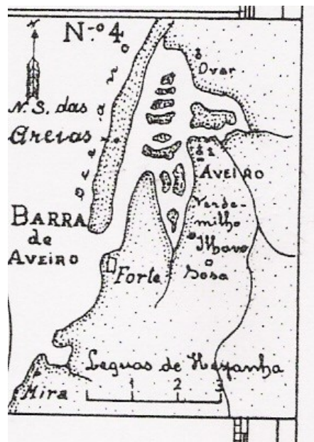
Fig 1 –Esquema da Barra onde é referida a localização do Forte Velho

E foi precisamente para defesa deste canal ,e para aí instalar as infra estruturas onde era feito o controlo (e respectivo pagamento) alfandegário ,que se instalou no extremo das Galefenhas ( ainda então anexadas a Vagos) ,no séc.XVII, o Forte Novo .( O Forte Velho existia na Vagueira, onde tinha sido construído em 1643 )