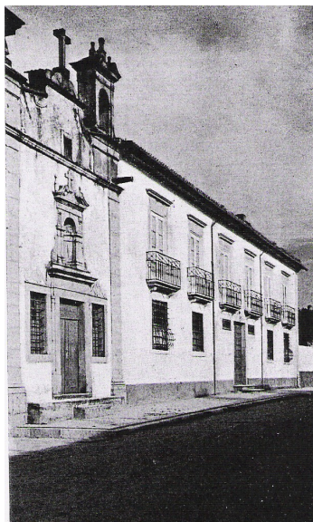
O Morgado da Srª da Nazaré