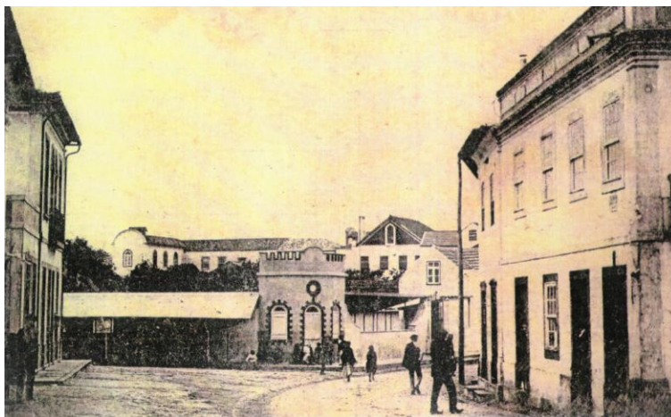
O Mercado de 1914

Foi só em 1925 , que a Câmara de Diniz Gomes decide a construção de um novo Mercado. Tratou-se – então sim! – de um edifício de uma certa monumentalidade, de traça muito bonita ,muito funcional para a época ,de linhas muito harmoniosas ,com vistosos pórticos de acesso ao seu interior ,a sul e nascente , realçados ao centro por uma construção inspirada nos torreões dos grandes mercados, do Porto e Lisboa. Localizava-se na esquina sul-nascente , voltada para estrada nacional, encimada por com uma cúpula em abóbada ,revestida a chapa metálica, pintada.