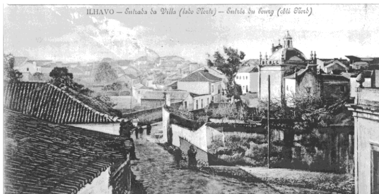
A Capela das Almas vista do Alto –Bandeira