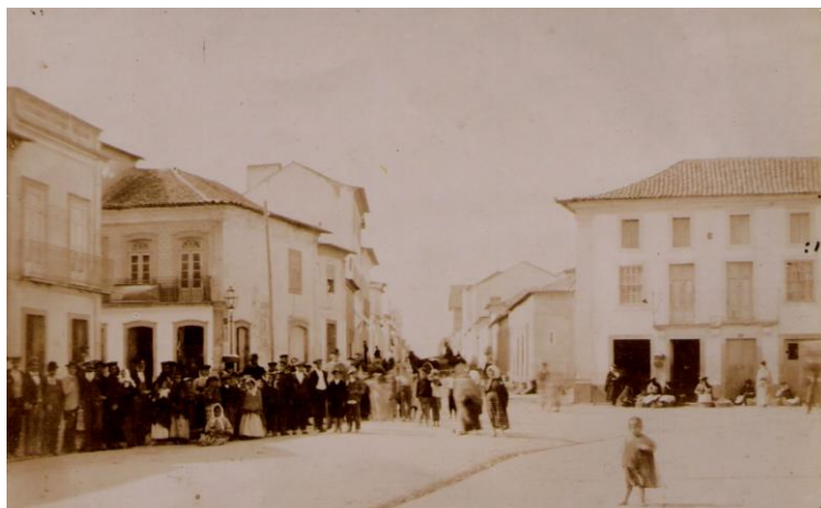
Praça com as vendedoras ao fundo

Em 1914 , a Câmara, da presidência de Joaquim Valente , decide edificar no mesmo local um Mercado Municipal, com o que pretendeu substituir a Praça Alexandre da Conceição (actual Praça da Republica), onde até então, depois de abandonado o Largo do Oitão , se fazia o mercadejar diário, na Vila.