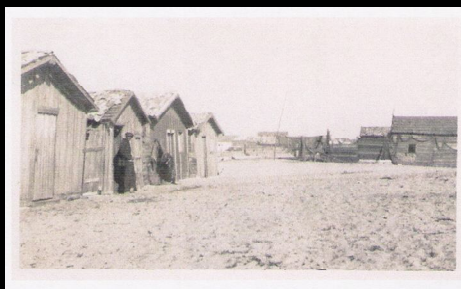
Os Palheiros dos Pescadores