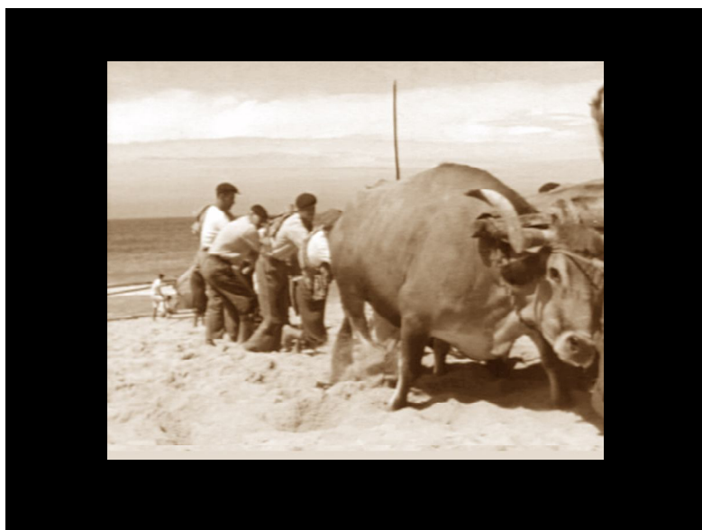
O lavar na borda