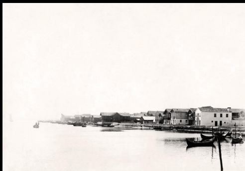
Costa-Nova (início séc.XX)