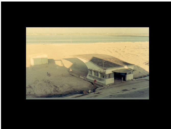
A «mota» no areal