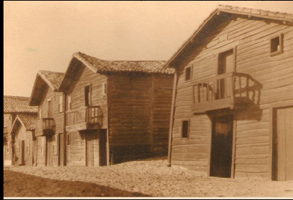
Os Palheiros ao Sul