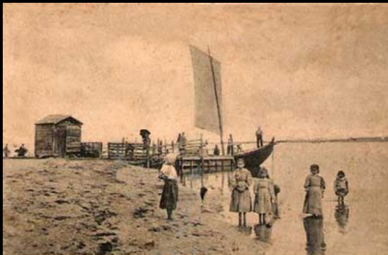
A Barca da Passagem 1900