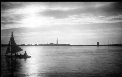
Passeando na ria