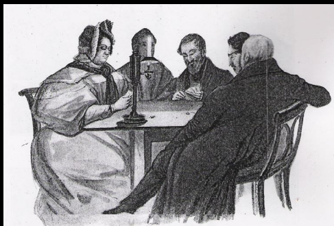
Os serões naquele tempo