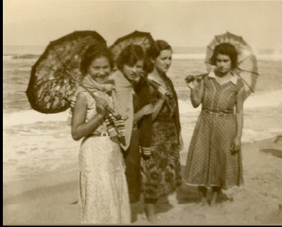
As Beldades anos 20