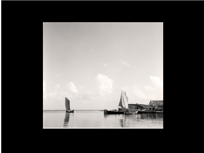
Ultimas imagens das barcas na mota