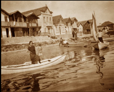
Costa-Nova anos 20